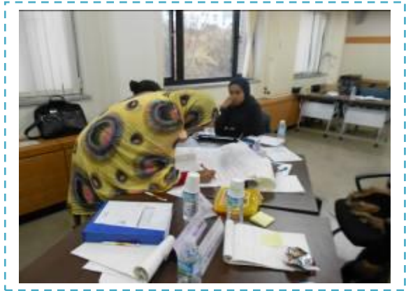
Les participants de la formation