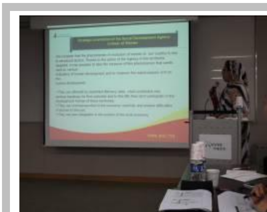
L'intervention de l'Agence dans les AGRF