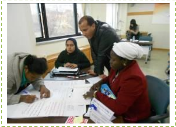
Travaux de groupes