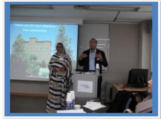
Interaction avec les questions des participants