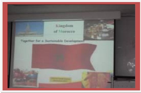
Page de garde de présentation